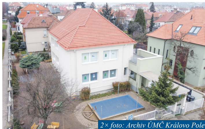
2× foto: Archiv ÚMČ Královo Pole