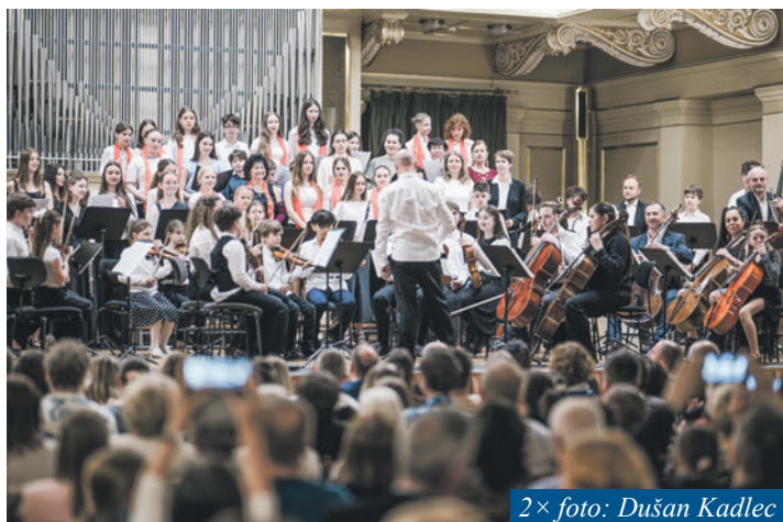
2× foto: Dušan Kadlec