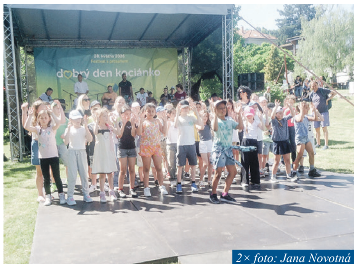
2× foto: Jana Novotná